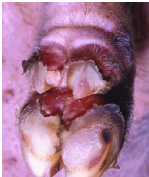
Kiterjedt hasadékok a körmök leválását megelőzően sertés lábvégen