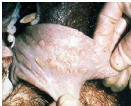
Felrepedt hólyagok sertés nyelven