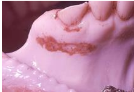
Hosszúkás erózió (felrepedt hólyag) szarvasmarha ínyen