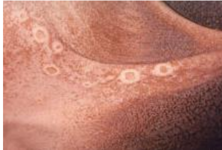
Több szabálytalan alakú erózió (megrepedt hólyagocskák) szarvasmarha bendőnyálkahártyán