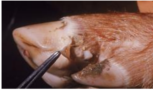
Felrepedt hólyag sertés lábvégen