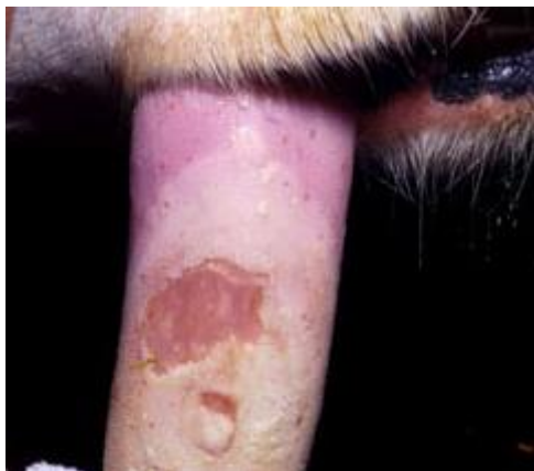
Több kisebb elváltozás összeolvadásából keletkezett erózió szarvasmarha nyelven