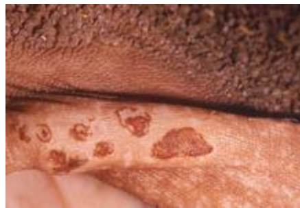
Több szabálytalan alakú erózió (megrepedt hólyagocskák) szarvasmarha bendőnyálkahártyán