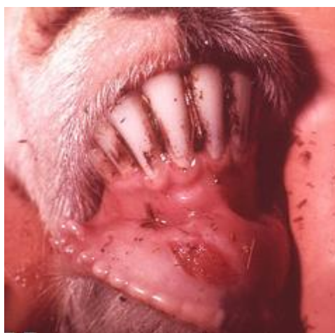
Kiterjedt erózió (felrepedt hólyag) kecske szájnyálkahártyán